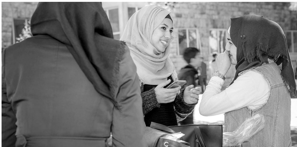
Bild: Weltgebetstag 2024 in Palästina wird vorbereitet/berliner-missionswerk.de

Und doch gerade deshalb ist es wichtig, dass Frauen, Männer, Kinder und Jugendliche rund um den ganzen Globus für Frieden in Palästina und Israel, aber auch sonst auf der ganzen Welt beten.